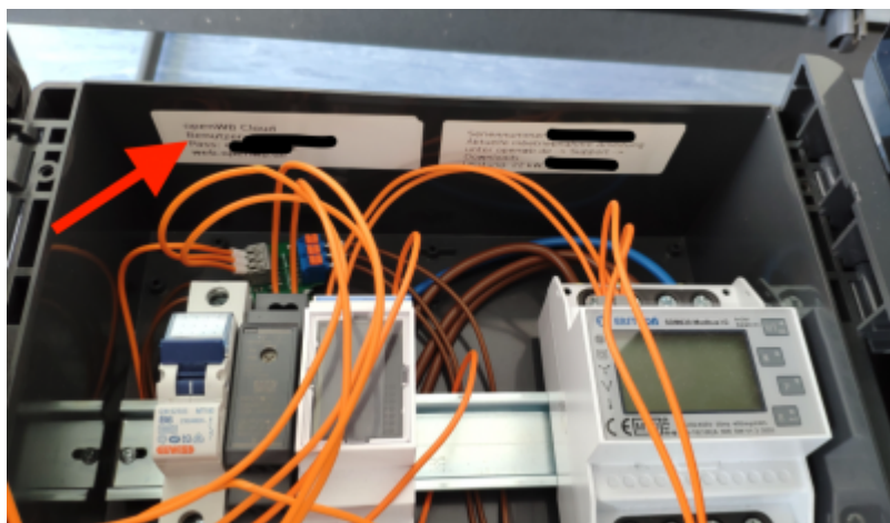
Aufkleber mit Cloud Daten

Sie finden die werksseitig vergebenen Cloud-Zugangsdaten entweder auf einem Aufkleber innenseitig, oben im Gehäuse der openWB bzw. bei Standalone außen (Pro und Satellit haben keinen Aufkleber, weil diese keine aktive Steuerung enthalten) oder falls Sie diese bereits verwenden und bereits an der Cloud angemeldet sind, im Web-Interface der openWB-Software unter Einstellungen → System → openWB Cloud. Sollte der Cloud-Zugang in der openWB-Software gelöscht worden sein, kann dieser mit o.g. Daten neu konfiguriert und gespeichert werden. Vor dem Öffnen des Gehäuses sind Ladungen zu stoppen, etwaige angeschlossene Fahrzeuge von der Wallbox zu trennen und die Leistungsschutzschalter (Sicherungen) der openWB auszuschalten. Bitte überlassen Sie Arbeiten an elektrischen Geräte einem Elektrofachbetrieb!